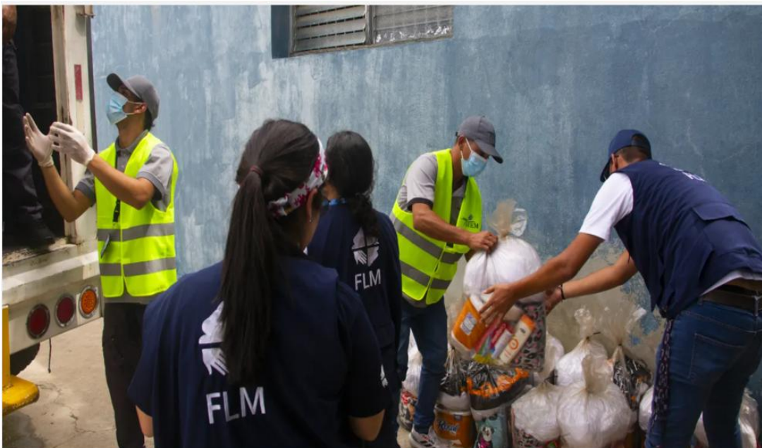
Working with local partners including churches, LWF staff put together relief kits for distribution in shelters at the Caribbean Maritime University, Catia La Mar, in La Guaira, Venezuela, on 30 June.

(LWI) - Poco más de una semana después de que dos potentes terremotos sacudieran el centro-norte de Venezuela, la Federación Luterana Mundial (FLM) está ampliando su respuesta humanitaria para ayudar a más personas desplazadas por la catástrofe, al tiempo que avanza hacia la recuperación.