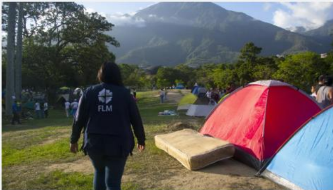
LWF staff conducting needs' assessments in El Junquito, Venezuela.

Su reflexión puso en palabras la experiencia compartida por millones de venezolanos. La pérdida no es solo material: para innumerables familias, también es la pérdida de madres, padres, hijos, amigos y comunidades enteras. Es una mezcla de sentimientos donde coexisten el dolor y la esperanza, mientras un pueblo conocido por su fortaleza y resiliencia encuentra aliento en la solidaridad recibida y en las historias de supervivencia y milagros que siguen surgiendo en medio de los esfuerzos de rescate y reconstrucción.