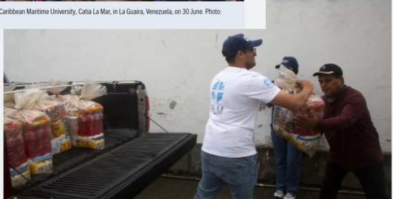
An LWF staff distributing a package of emergency relief items in El Junquito, Venezuela.

incertidumbre tras cientos de réplicas. Los terremotos del 24 de junio causaron una destrucción generalizada en La Guaira, Caracas, Miranda, Carabobo y Falcón, dejando a miles de personas desplazadas y causando daños en viviendas, servicios públicos e infraestructuras esenciales.