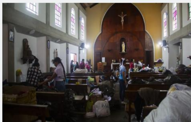
One of the locations visited was the collection and distribution center at El Junquito Church, where donations for the affected communities are received, sorted, and distributed.